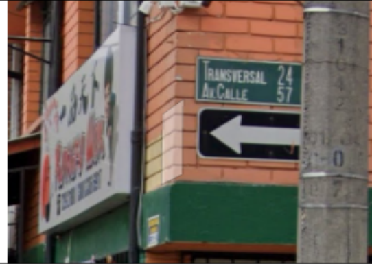
Fotografía No 2. Nomenclatura más cercana.